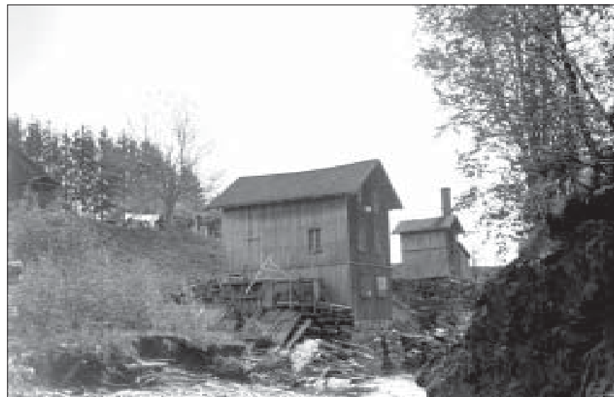
Nederst: Voksen mølle.