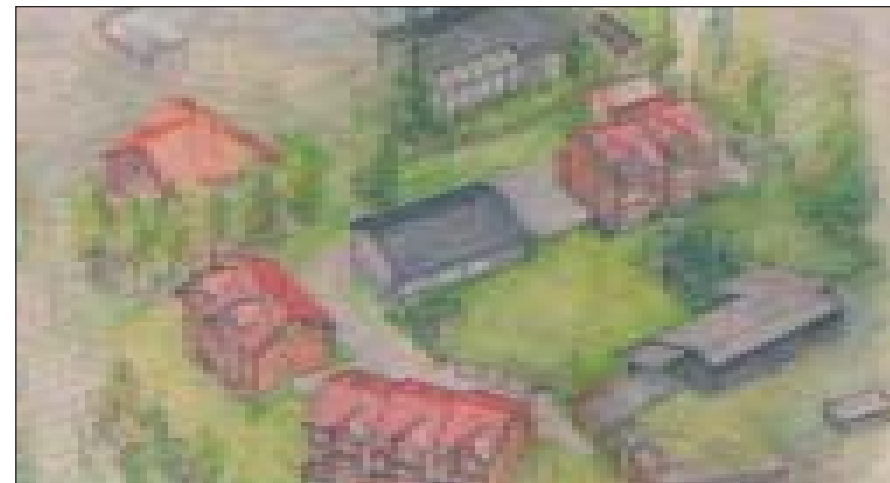
Lavblokkene til venstre ville ikke blitt godkjent i dag. Småhusene over passer ikke inn i strøket mener kommunen. Alle utklippene er hentet fra Aftenposten Aften 20.08.2004

Ifølge Ullern Avis Akersposten 2. juni vandret bydelspolitikere rundt i Vinderenområdet for å se på tomter hvor ”utbyggingen kanskje kunne vært løst på en annen måte, for å si det mildt”. Kan ikke politikere og reguleringsmyndigheter lære av gamle dumheter?