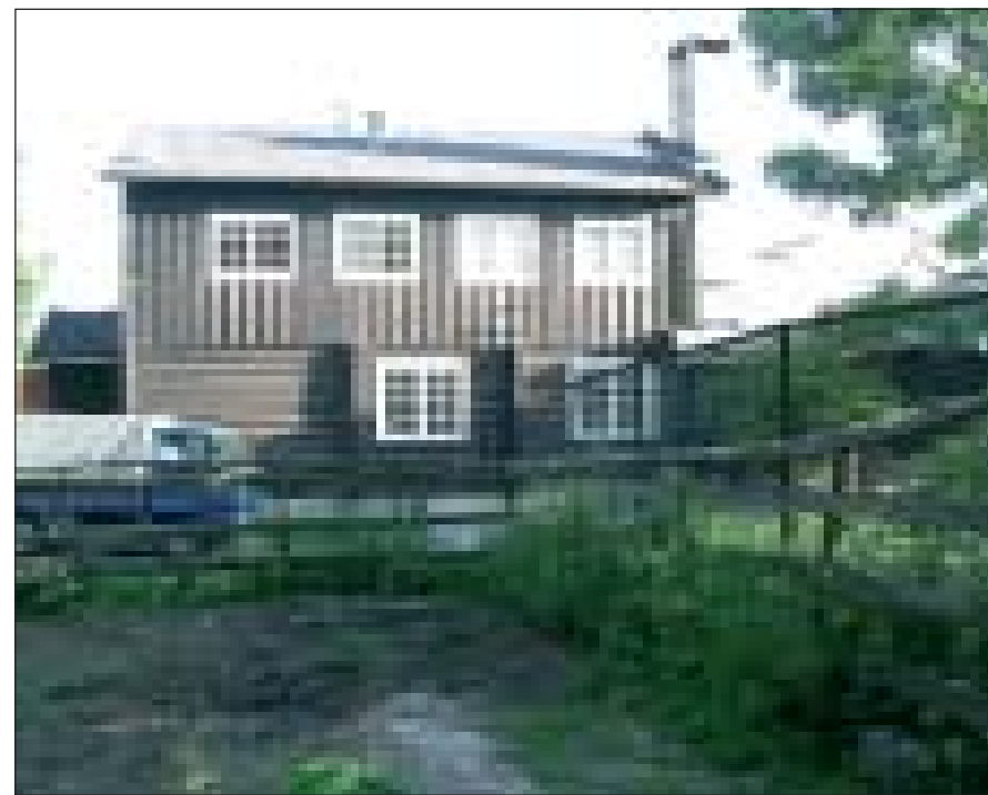
Kjernen i Helge Ingstads hus med de originale tømmervegger i første etasje.

Helge Ingstad elsket å bo her. Han hadde sine jevnlige turer til Fuglemyra på toppen av Vettakollen, hvor han tok sin morgengymnastikk. Sammen med sin kjære kone Anne Stine hadde han her et levende miljø med kunstnere og forfattere i det vakre hjemmet. De satte begge stor pris på naturen rundt, og ikke minst den fredelige atmosfæren som preget stedet Brattalid.