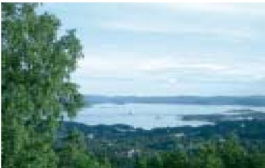
Over: Utsikten fra plenen foran Brattalid.